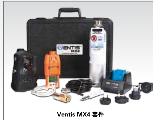
Ventis MX4 套件