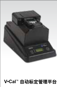
V-Cal™ 自动标定管理平台