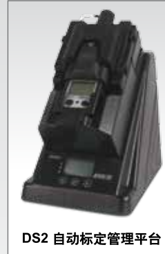
DS2 自动标定管理平台