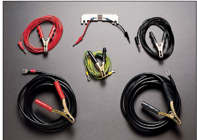
测试电缆组GA-02053, GA-00200和电流负载BD-90022。