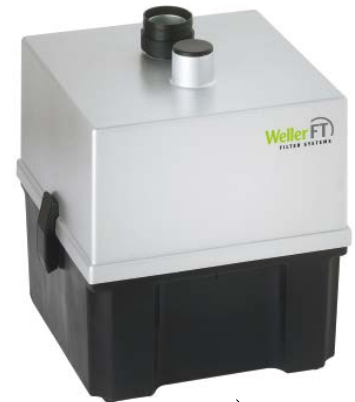
> Zero Smog 2吸烟仪