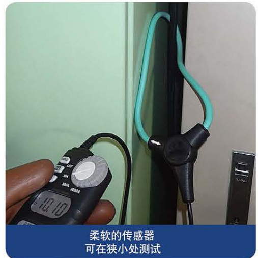
柔软的传感器 可在狭小处测试