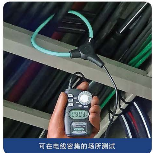
可在电线密集的场所测试